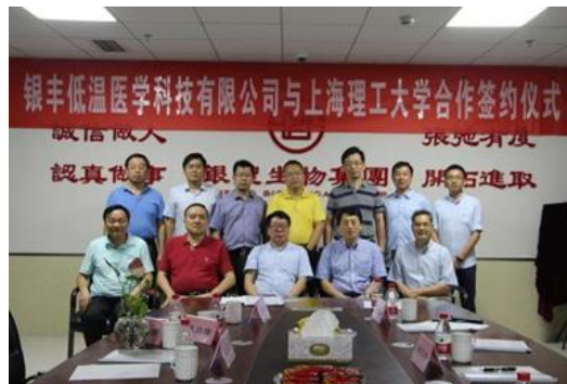
与会领导、专家合影