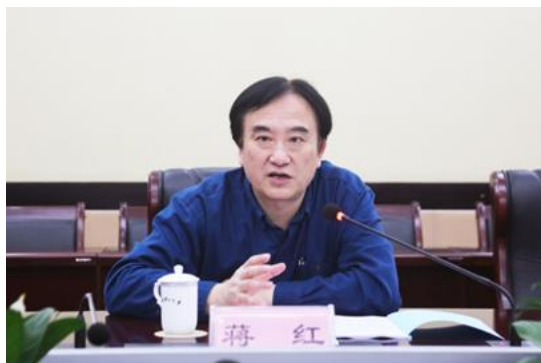
上海市教委蒋红巡视员一行来校调研