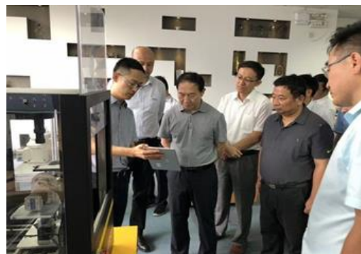
实地考察沈机（上海）智能系统研发设计有限公司