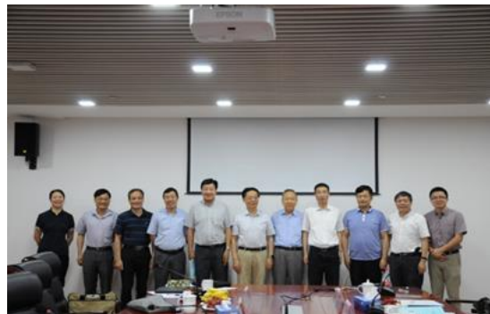
学术委员会会后合影