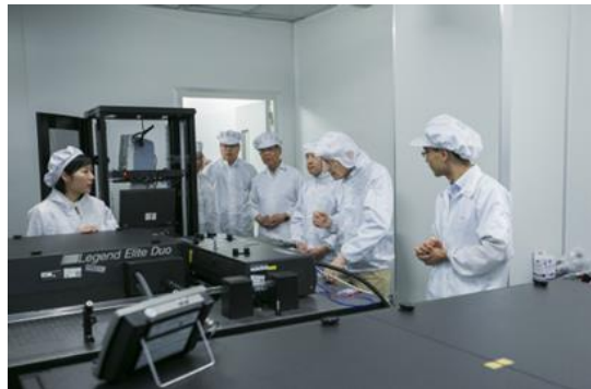
安东尼·莱格特教授参观光电学院实验室