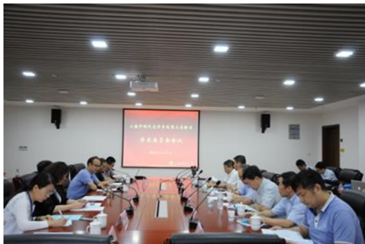
学术委员会会议现场