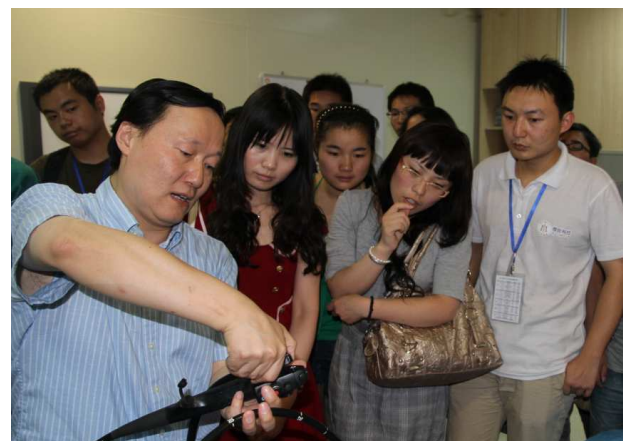
长海医院现场教学