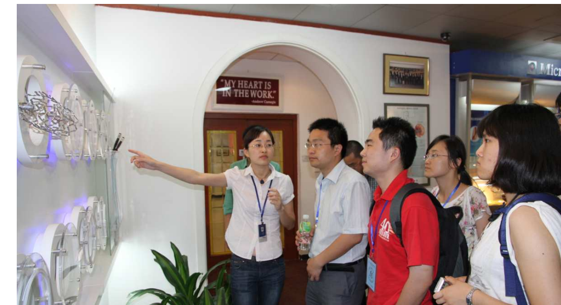
参观 微创 医疗 器械 公司